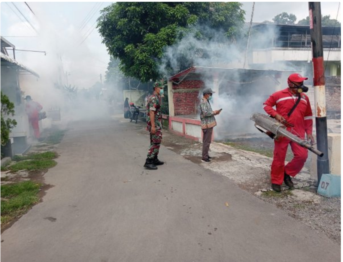
Babinsa Koramil 0804/06 Maospati Dampingi Petugas Kesehatan Laksanakan Fogging