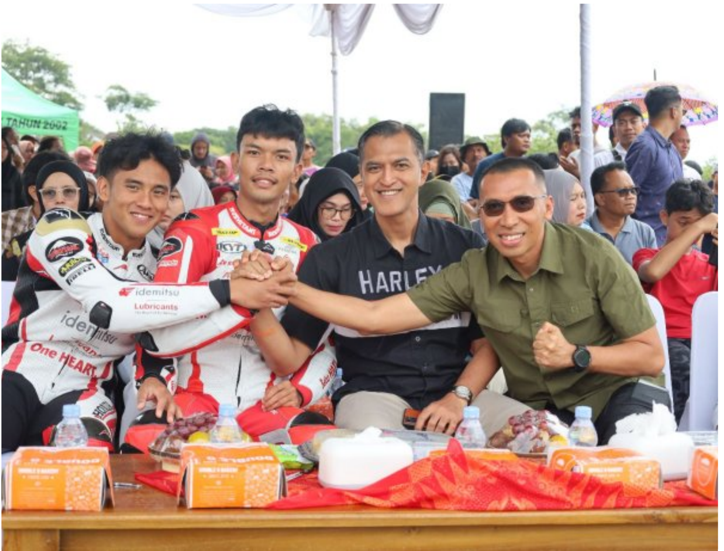
Dandim 0804/Magetan Hadiri Undangan Tinjau Sirkuit Magetan