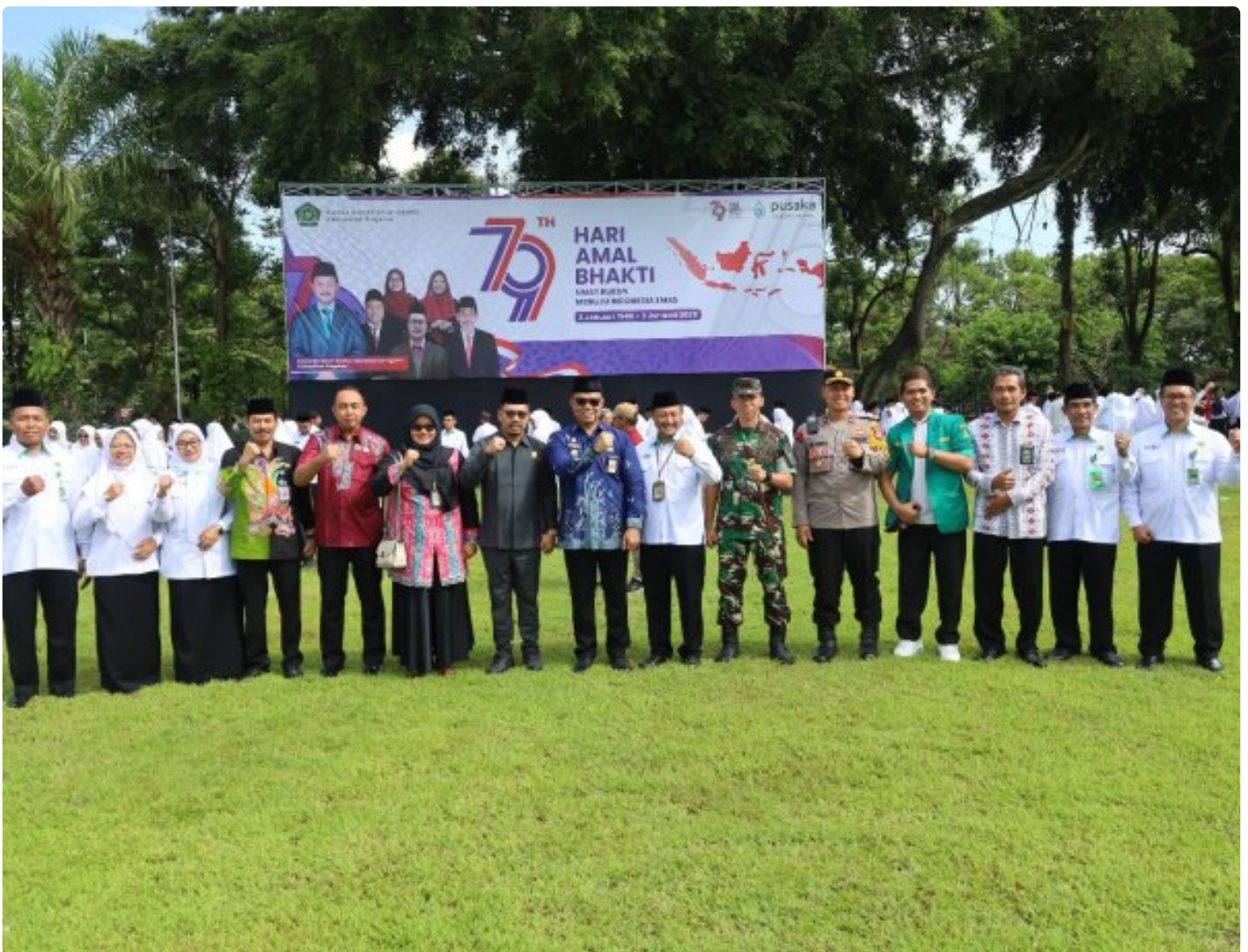
Dandim 0804/Magetan, Hadiri Upacara Hari Amal Bhakti ke-79 Kemenag RI Tahun 2025