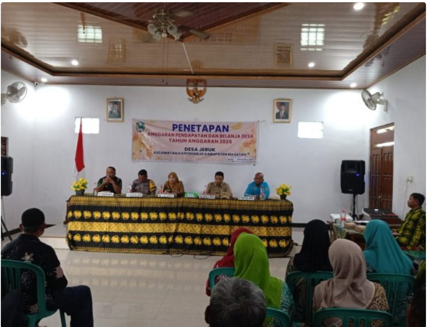
Danpos Koramil 0804/08 Barat Hadiri Penetapan APBDes 2025 di Balai Desa Jeruk