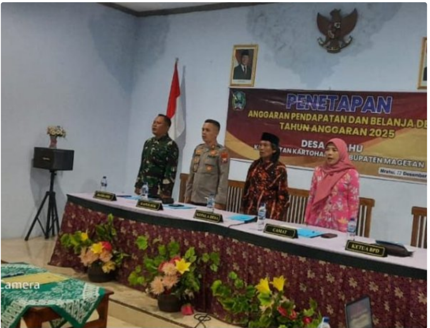
Danpos Peltu Nanang Hadiri Penetapan APBDes 2025 di Balai Desa Mrahu