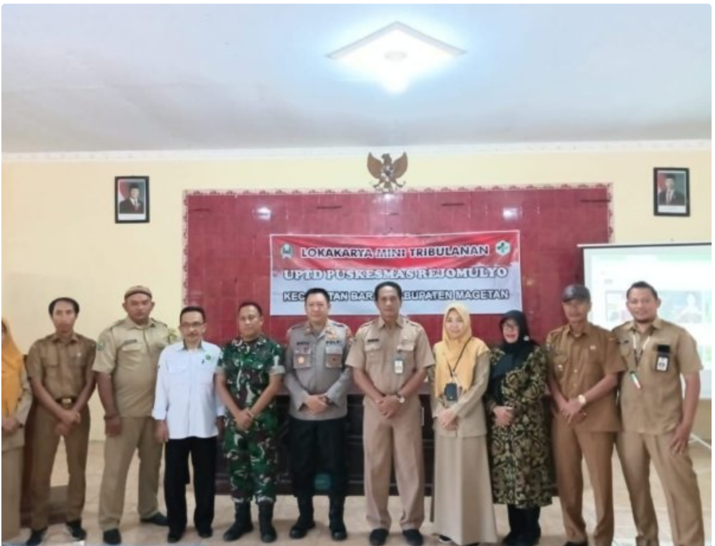
Danramil 0804/08 Barat Hadiri Lokakarya Mini Tribulan IV UPTD Puskesmas Rejomulyo